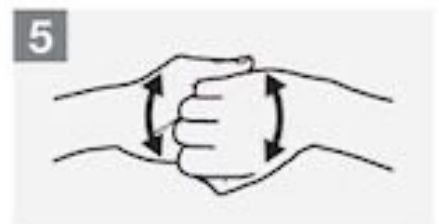
5 Wrijf met de achterkant van je vingers tegen je handpalmen