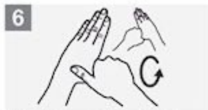
6 Maak cirkels met je linkerduim in je rechterhand en omgekeerd