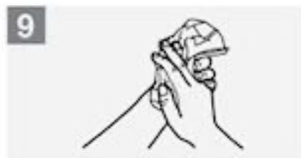
9 Droog je handen