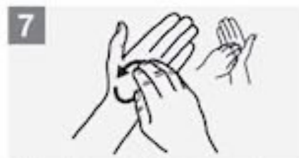
7 Maak cirkels met je vingers over je handpalm en handrug