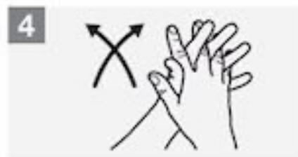
4 Wrijf handpalm tegen handpalm met gekruiste vingers