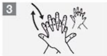
3 Wrijf met gekruiste vingers je rechterhandpalm over je linkerhandrug en omgekeerd