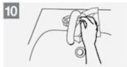
10 Draai de kraan toe met een doekje