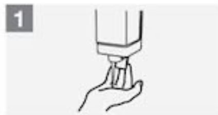
1 Gebruik genoeg zeep