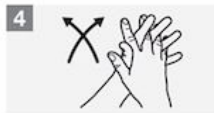
4 Wrijf handpalm tegen handpalm met gekruiste vingers