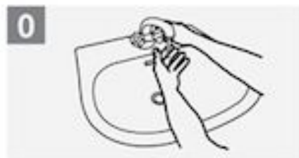
0 Maak je handen nat met water