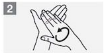
2 Wrijf handpalm tegen handpalm